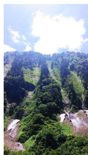
称名滝およびその周辺の景色